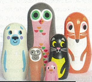
Matrjošky Animals 2, 699 Kč

Pokud z některých mých tipů usuzujete, že trpíte lehkou formou infantilnosti, máte pravdu. Ale uznajte, že matrjošky z on-line obchodu se skandinávským zbožím Designville.cz, které jsou určeny hlavně pro děti, potěší a rozsvítí den i leckterému dospělému. Já mít zvíře s takovým kukučem na pracovním stole, chodím do redakce snad i o víkendech. Lucie Šilhová